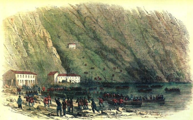
LANDING OF A PART OF THE NATIONAL ARMY AT THE MARINA DI PALMI, CALABRIA.—FROM A REPORT BY OTTO VON GUERLÉ, ASSISTANT CONSUL, 1848. (SEE NEXT PAGE.)