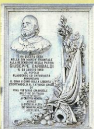
In alto: la targa in onore di Giuseppe Garibaldi, posta sul Corso di Palmi;